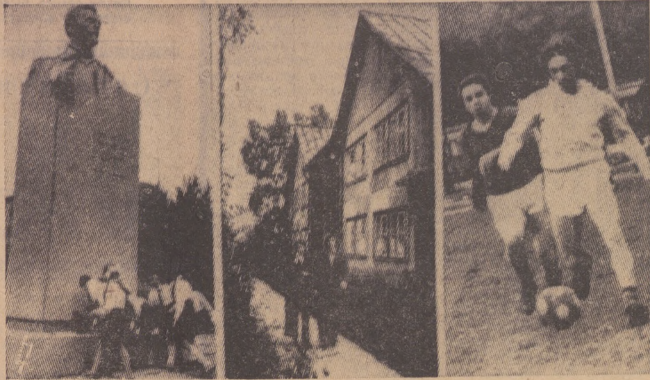
Редактор С. И. ЛЕКАНОВ.