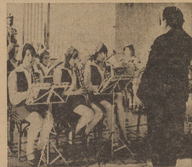
На снимке: «Серебряные трубы».