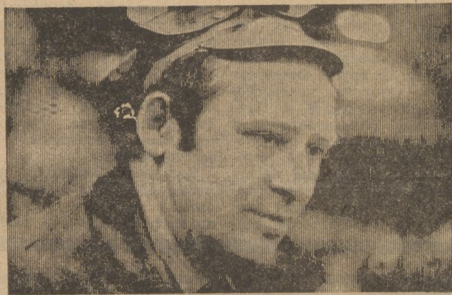
Адрес передового опыта: работать без отстающих