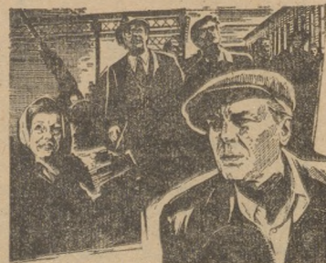
ОСОБО ВАЖНОЕ ЗАДАНИЕ

С 23 марта демонстрируется новый цветной широкоформатный фильм в 2-х сериях киностудии «Мосфильм». Фильм, поставленный народным артистом СССР Евгением Матвеевым, посвящается самоотверженному труду советского народа в тылу во время Великой Отечественной войны.