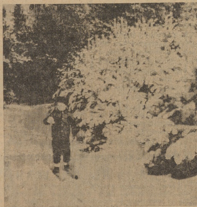
ХОРОШО В ЛЕСУ!