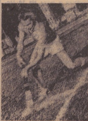
■ ЧЕМПИОНАТ СССР ПО ХОККЕЮ НА ТРАВЕ