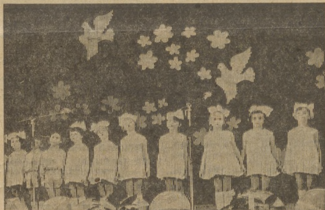
ДЕТИ ПОЮТ О МИРЕ.

И. КРИВИЦКИЙ, нестатный инспектор госторинспекции и горторготдела.