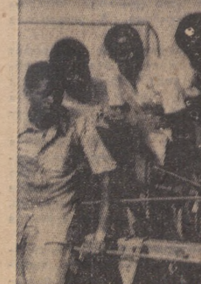
Комплекс включает в себя классы и лабораторию, слесарные и механические мастерские, жилые корпуса для преподавателей.

КАМЕРУН. Новый учебный комплекс сельскохозяйственной школы в городе Чанг, построенный при содействии Советского Союза, является центром подготовки квалифицированных специалистов для сельского хозяйства.