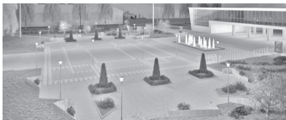
Во время масштабного опроса горожан площадь ДК набрала больше всего голосов «за». Подтвердить актуальность проекта предстоит 18 марта во время специального рейтингового голосования

— Может быть это немного громко сказано, но за всем этим стоит преобразование левого берега. Я жителям говорил еще в 2011 году: у вас на левом берегу будет гораздо красивее, чем на правом. Такова специфика: по центральной части Арамилы прохо-