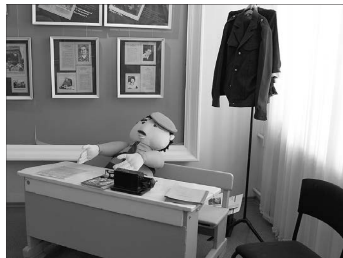
Парта и школьная форма теперь - экспонаты музея.

Среди экспонатов музея есть и личные вещи выпускников, и советская школьная форма, и пионерские значки, и даже парта, за которой сидели ученики много десятилетий назад. Кстати, на ней можно увидеть букварь, самый первый журнал, аттестат зрелости, пишущую машинку «Феликс» - все то, что