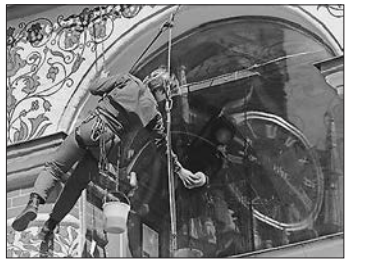
27 марта часы на Спасской башне переведут на летнее время в последний раз.

скую башню и переведут стрелки на час вперед.