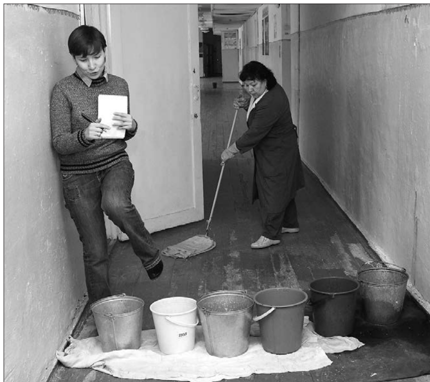
* Чтобы на полу не образовывались лужи, приходится подставлять ведра.