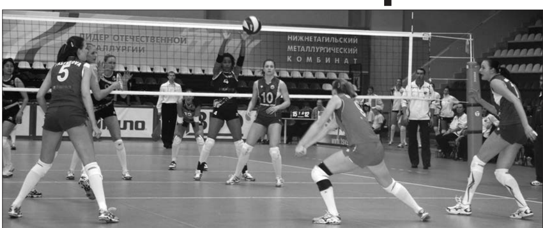
Момент игры «Уралочка-НТМК» - «Азеррейл».

«Уралочка-НТМК» не сумела преодолеть полуфинальный барьер европейского Кубка вызова, уступив в родных стенах команде «Азеррейл» из Азербайджана - 1:3. Матч в Баку также завершился в пользу соперниц - 3:2.