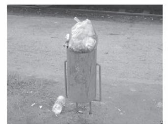
В урне куча бытовых отходов?! Это дело моральных ...

Лица, выбрасывающие в урны мешки с мусором, будут привлечены к административной ответственности.