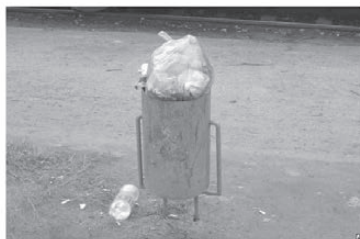
В урне куча бытовых отходов?! Это дело моральных ...

Лица, выбрасывающие в урны мешки с мусором, будут привлечены к административной ответственности.