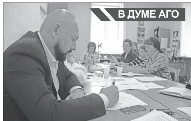
В ДУМЕ АГО

Третьим пунктом повестки дня были внесены изменения в думское решение «Об утверждении структуры Администрации Арамильского городского округа в новой редакции», затем утверждено положение об общественной палате. О создании этого консультативно-совещательного органа в Арамили говорилось давно, но организационные моменты «по поводу» заняли весьма основательное количество времени. В окончательном варианте в ее состав войдет 27 человек: девять из них будет утверждено главой АГО, еще девять Думой из числа представителей общественных и религиозных объеди-