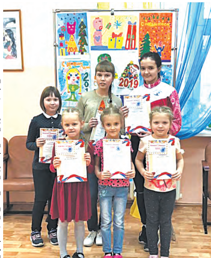
Победители конкурса рисунков

С каждым годом дети в своих рисунках отражают актуальные аспекты ЖКХ, показывают важность этой сложной сферы в повседневной жизни человека.