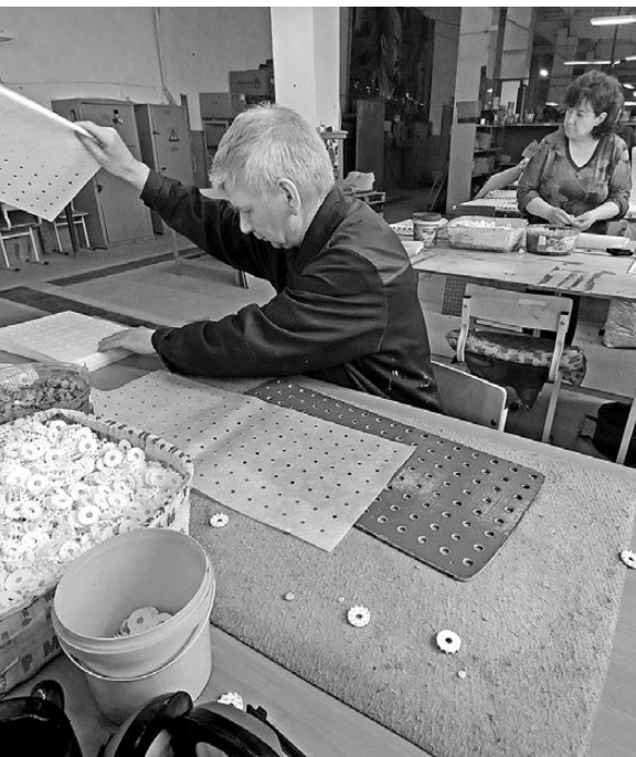
Больше всего инвалидов трудится на предприятиях Всероссийского общества слепых.

Многие люди с ОВЗ всего этого не знают и даже не пытаются устроиться на работу, боясь потерять пенсию по инвалидности, хотя уровень зарплат на нее никак не влияет. Для сведения: у инвалидов первой и второй групп 35-часовая рабочая неделя, отпуск не менее 30 календарных дней и отпуск без сохранения содержания до 60 дней в году. ●