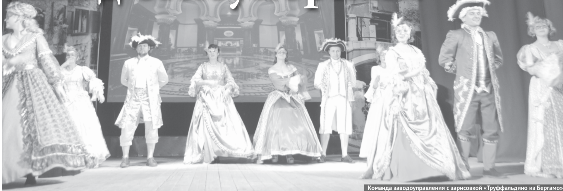
Команда заводоуправления с зарисовкой «Труффальдино из Бергамо».

В ДиКЦ состоялся традиционный смотр-конкурс художественной самодеятельности среди работников Богдановичского ОАО «Огнеупоры». Он проходил под лозунгом «Богат талантами завод»