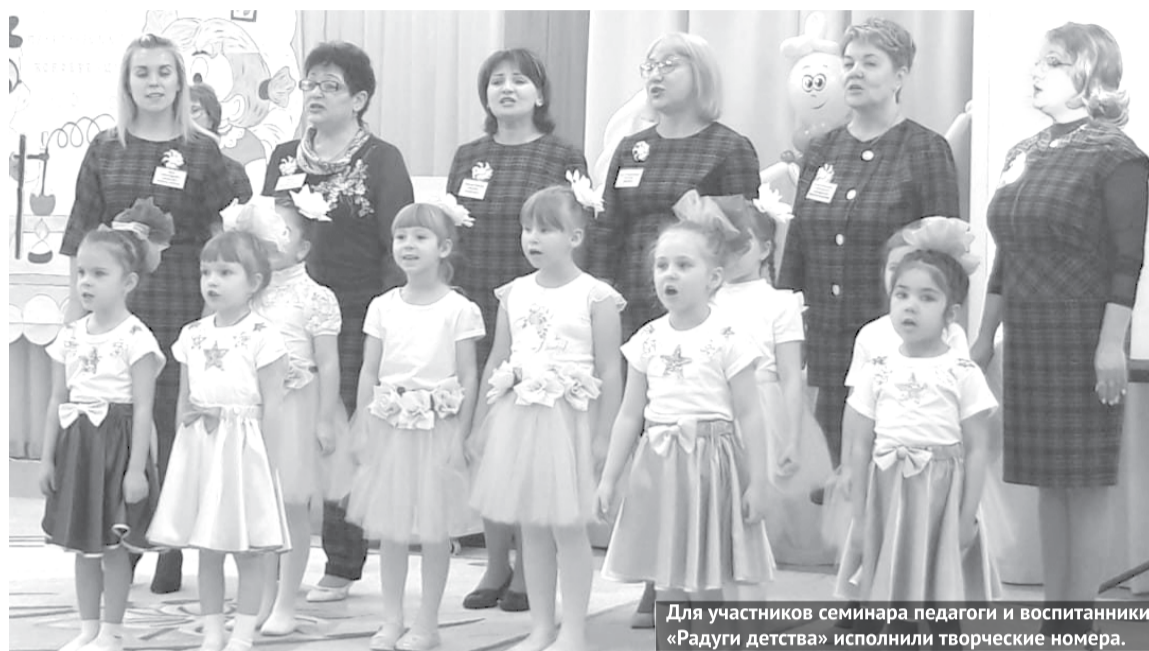
Для участников семинара педагоги и воспитанники «Радуги детства» исполнили творческие номера.