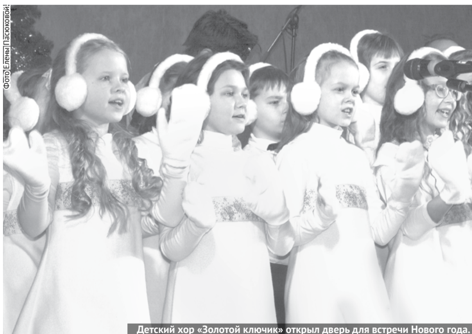
Детский хор «Золотой ключик» открыл дверь для встречи Нового года.

Совсем скоро придет Новый год. По доброй традиции творческий проект «Квартирники на Советской» дал старт встрече Нового года большим музыкальным спектаклем «Happy New Year!»