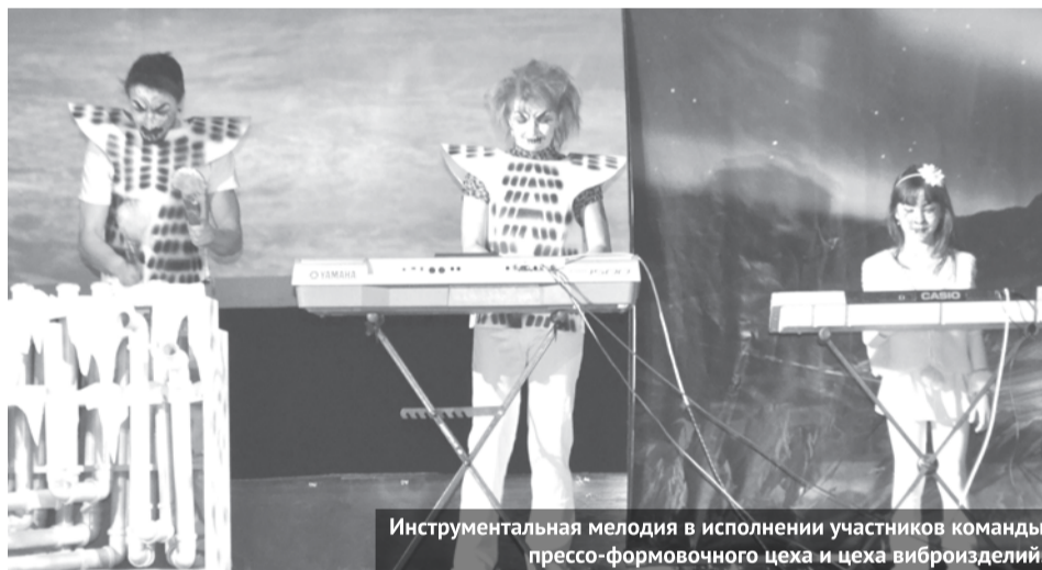
Инструментальная мелодия в исполнении участников команды прессо-формовочного цеха и цеха виброизделий.