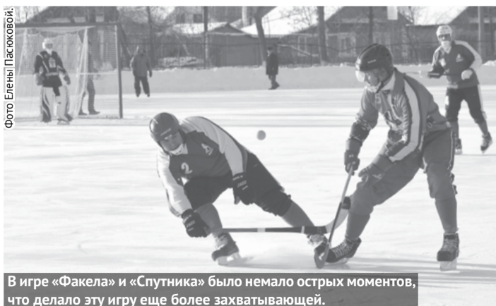
В игре «Факела» и «Спутника» было немало острых моментов, что делало эту игру еще более захватывающей.

В минувшие выходные «Факел» сыграл вторую игру в рамках первенства Свердловской области по хоккею с мячом. На радость болельщикам нашей сборной игра вновь проводилась в Богдановиче