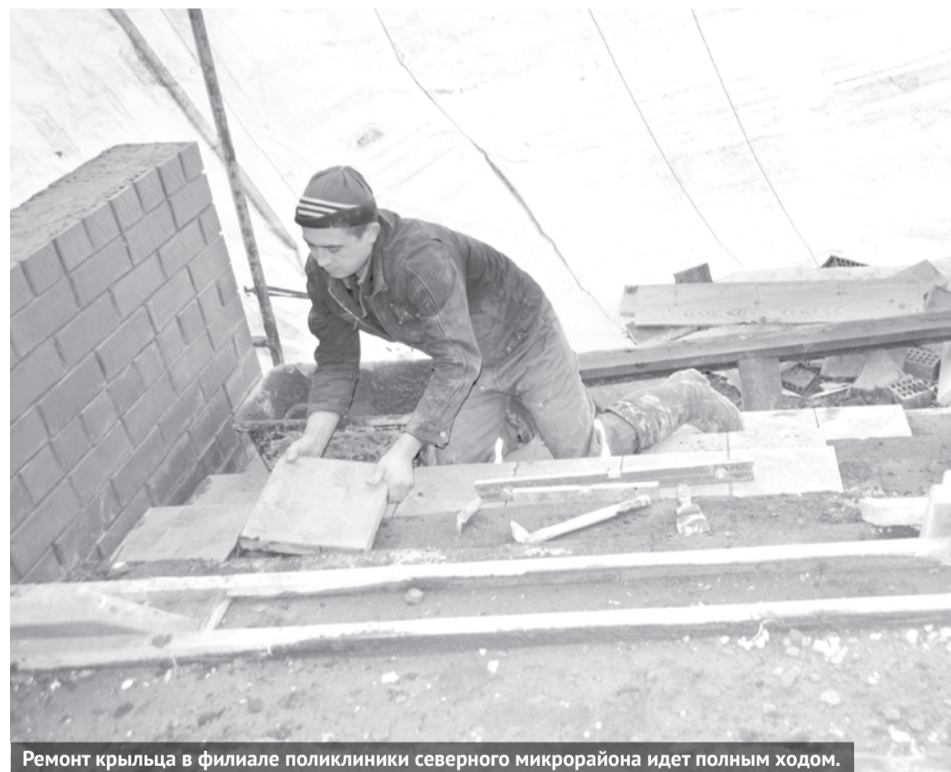
Ремонт крыльца в филиале поликлиники северного микрорайона идет полным ходом.

Мы искренне благодарны всем людям, которые участвуют в жизни больницы, оказывают нам помощь и поддерживают.