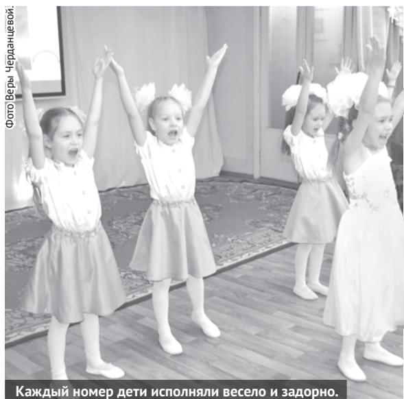
Каждый номер дети исполняли весело и задорно.

Членам жюри было непросто определить победителя. На самом деле, победили все участники фестиваля, они были отмечены в разных номинациях и награждены грамотами и подарками.