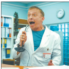
ТНТ • 17.00 Т/с «Интерны» (16+)