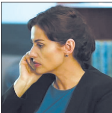
Россия-1 • 21.00 Т/с «Тайны следствия-18» (12+)