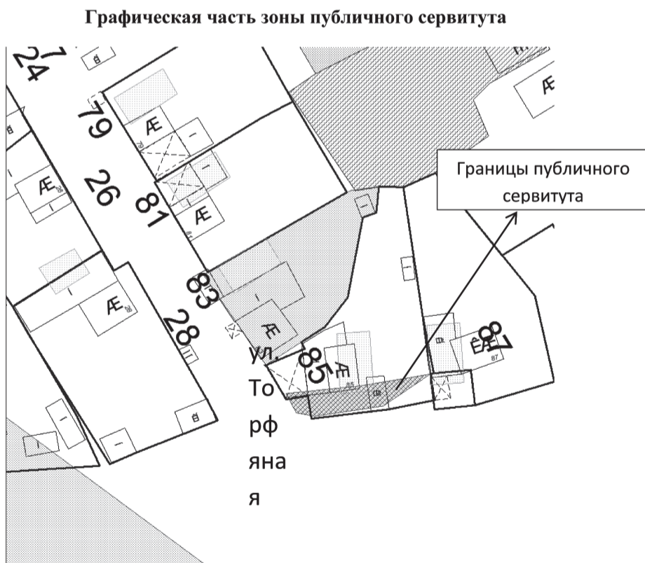
Таблица координат характерных точек границ территории

Земельный участок, расположенный по адресу: г. Нижний Тагил, ул. Торфяная, 85 с кадастровым номером 66:56:0112011:96