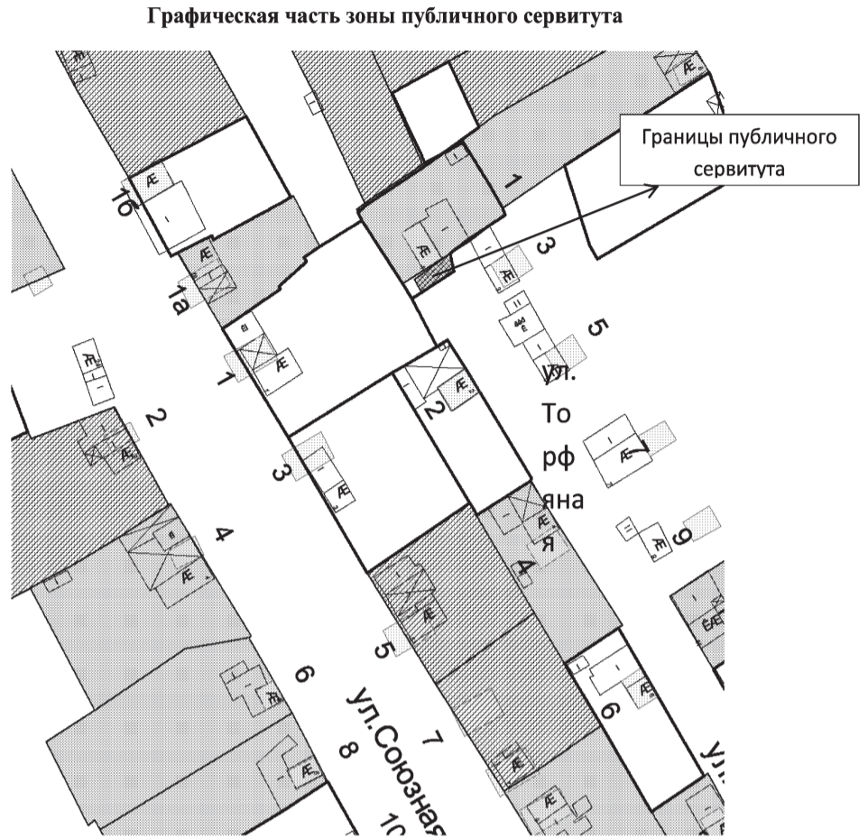
Таблица координат характерных точек границ территории

Земельный участок, расположенный по адресу: г. Нижний Тагил, ул. Торфяная, 1 с кадастровым номером 66:56:0112011:13