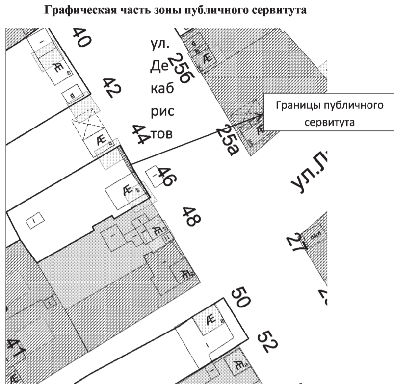
Таблица координат характерных точек границ территории

Земельный участок, расположенный по адресу: г. Нижний Тагил, ул. Декабристов, 44 с кадастровым номером 66:56:0112011:31