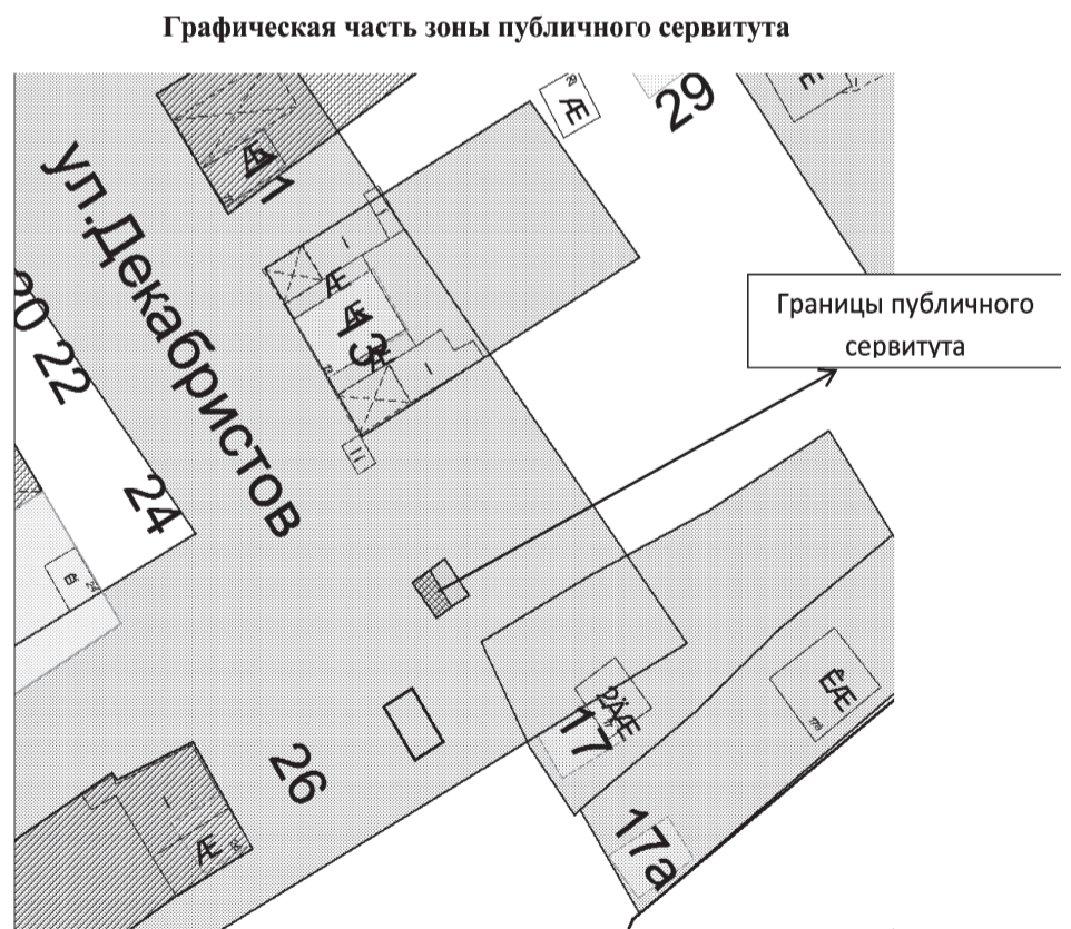
Таблица координат характерных точек границ территории

Земельный участок, расположенный по адресу: г. Нижний Тагил, ул. Декабристов с кадастровым номером 66:56:0000000:18913