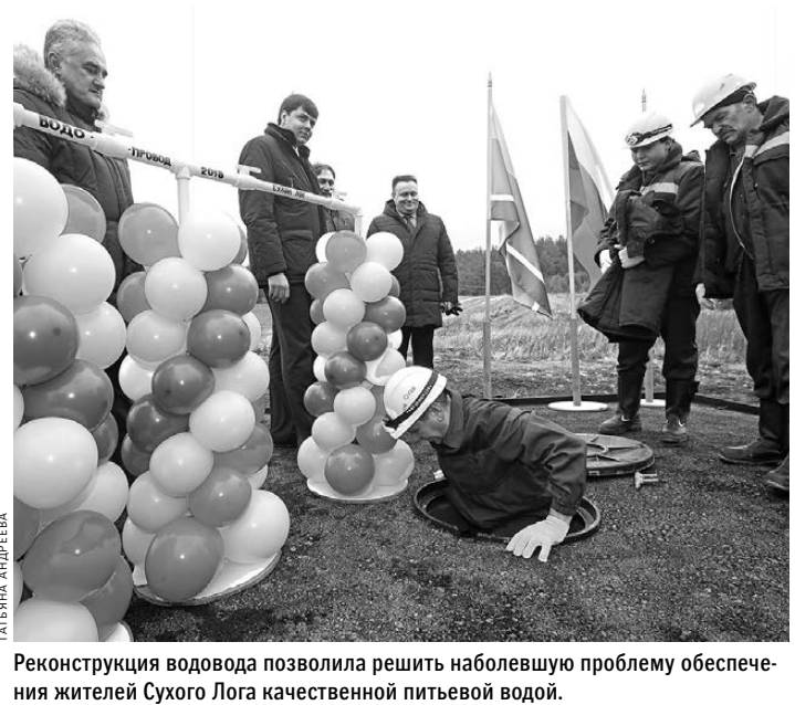
Реконструкция водовода позволила решить наболевшую проблему обеспечения жителей Сухого Лога качественной питьевой водой.

Кстати, в отношении директора ОГТ ранее уже было возбуждено административное дело по статье о невыплате заработной платы. ●