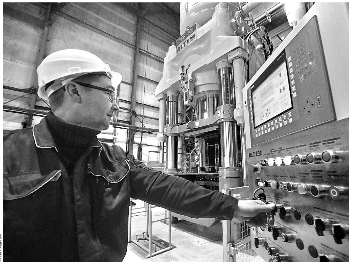
В Богдановиче на предприятии, производящем огнеупоры, запущен новый пресс. Агрегат высотой с четырехэтажный дом позволит предприятию освоить выпуск крупнотоннажных изделий, используемых в черной, цветной металлургии, стекольной промышленности. Инвестиции в проект превысили 100 миллионов рублей, создано 15 новых рабочих мест.

Отличие этой модели от серийного полувагона заключается в инновационной тележке с повышенной осевой нагрузкой, увеличивающей грузоподъемность, межремонтный пробег и объем кузова. Преимущества такого полувагона обуславливают и более высокую цену, поэтому сейчас спрос на обе модели распределяется в соотношении 50 на 50. Производственные планы предприятия на 2019 год примерно такие же, как и на текущий. ●