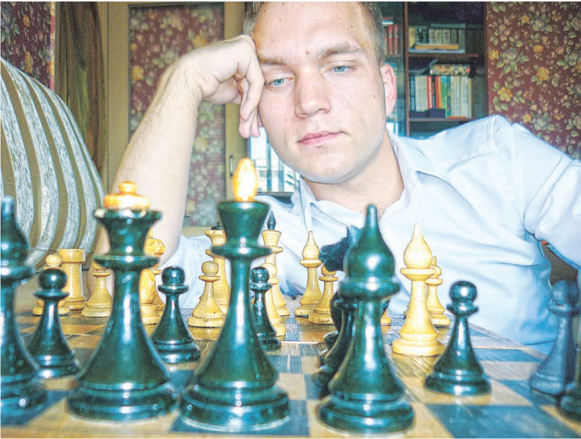
АРХИВ АЛЕКСАНДРА КОНЦЕВОГО

Рассеянный склероз — заболевание центральной нервной системы. Оно не имеет ничего общего со