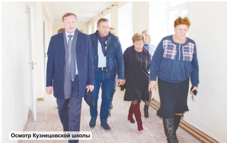
Осмотр Кузнецовской школы