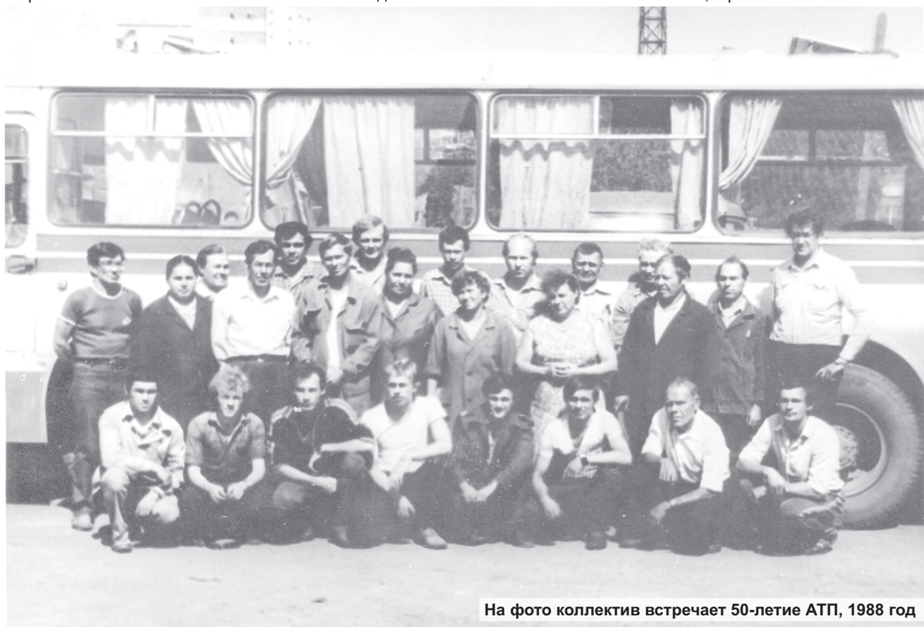
На фото коллектив встречает 50-летие АТП, 1988 год

вом, транспорт стал обновляться, появились первые городские автобусы - "ЛиАЗы", которые ходили по маршруту "Талица - вокзал".