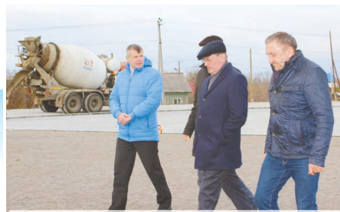
От прежнего облика стадиона остались лишь ворота. На прошлой неделе снесли остатки старого деревянного забора.

Начало учебного процесса в Кузнецовском намечено на вторую четверть, с ноября. Ведь 135 учеников Кузнецовской школы вынуждены из-за капитального ремонта ездить на учебу в соседнюю Чупинскую школу, а 30 с лишним дошколят (детский садик находится также в стенах школы) вообще сидят по домам.