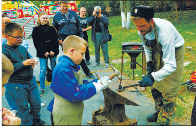
Сам выковал гвоздь. Будет, что маме показать

В минувшую субботу первоуральцы побывали в Казачьей слободке. Жизнь казацкого мини-хутора организаторы праздника, в их числе ЦКС Первоуральска, воссоздали в Парке новой культуры. В рамках XIII Фестиваля традиционной казачьей культуры «Сторона моя, сторонушка».