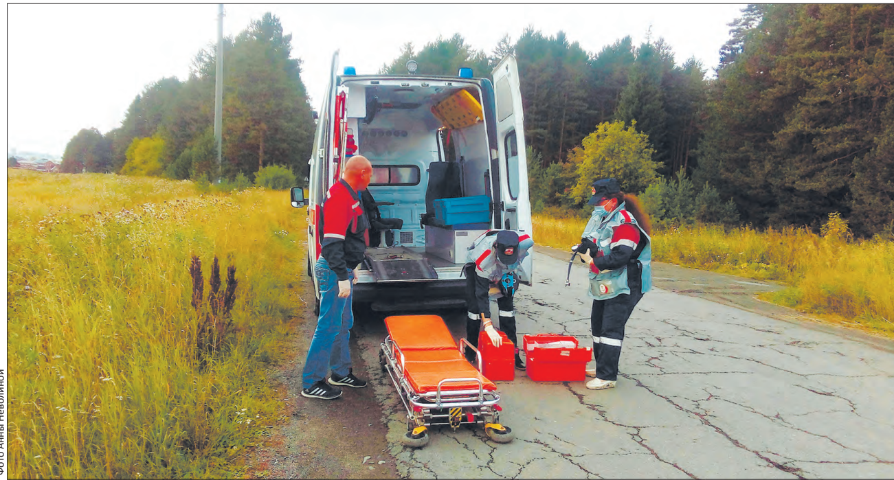
По легенде, одного из пострадавших водителей отправили в Екатеринбург в ожоговый центр

В минувший понедельник первоуральские спасатели и сотрудники экстренных служб были подняты по тревоге в связи с угрозой чрезвычайной ситуации: рядом с городом загорелся газопровод высокого давления, в любой момент газ мог взорваться. Благо, это были лишь учения, но действовать было необходимо как в реальной ЧС.