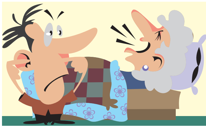
ИЛЛУСТРАЦИЯ ПЕТРА УПОРОВА.

По материалам сайта http://lolstory.ru подготовила Надежда СТАРКОВА.