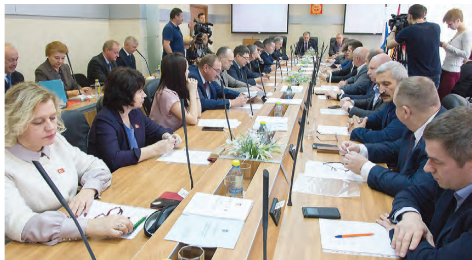
Депутаты горДумы голосовали за кандидатуру мэра открыто и поименно.

Он рассказывает, не читая по бумагам, обращаясь к депутатам. Легко оперирует данными по актуальным проблемам городских сфер. Отдельно подчеркивает важность взаимодействия всех уровней и ветвей власти.