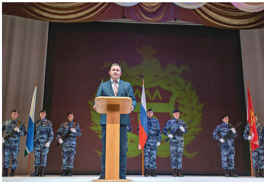
Владислав Пинаев на церемонии инаугурации.

Вчера в драматическом театре Владислав Пинаев принес присягу на специальном экземпляре устава города и официально вступил в должность главы города.