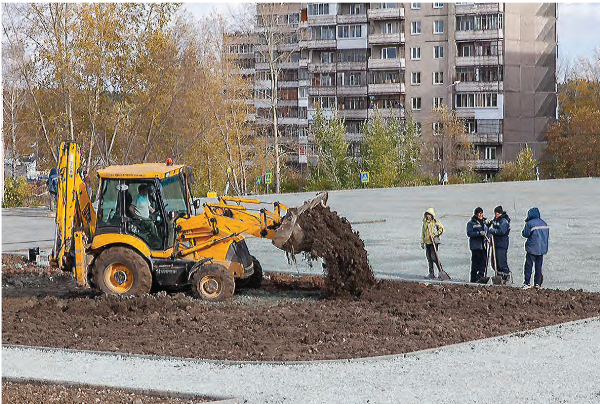
Основная часть работ выполнена.

Об этом заявил подрядчик на выездном совещании на строительной площадке. Специалисты компании «Урал Инжиниринг» приступили к возведению спортобъекта полтора месяца назад.