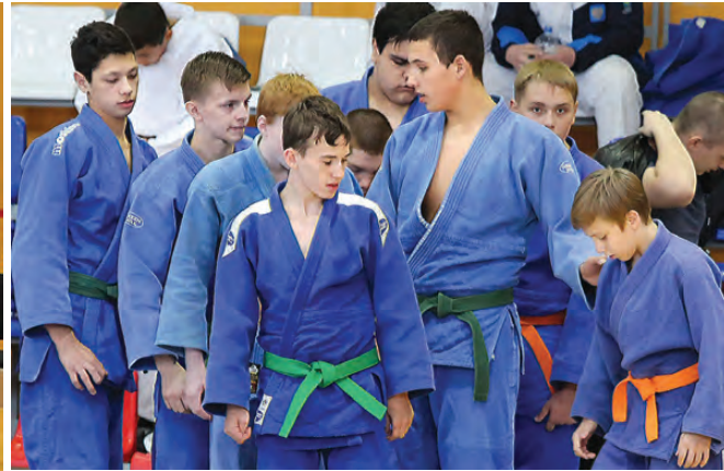
Первыми вступили в борьбу екатеринбуржцы (в белых кимоно) и тагильчане (в синих кимоно).