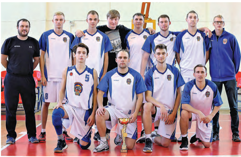
Гости из Казахстана.