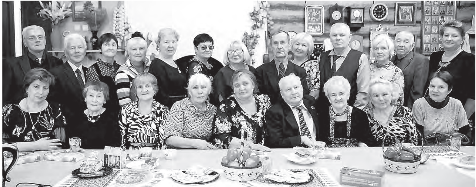
За праздничным столом.

Кому же, как не нашему подрастающему поколению, передать историю ВГОКа, все материалы, которые мертвым грузом лежат в наших музеях: об истории создания памятника-обелиска погибшим горнякам, о заслуженных людях, о погибших и живых ветеранах войны и тружениках тыла. Все это мы обязаны сохранить и передать нашим внукам и правнукам, которые пронесут все это через годы, через века. И желание этих любознательных детей и учителей создать проект – это