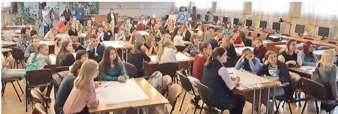
Готовых впитать новые идеи собрался полный зал.

ших проектах в этой сфере, проводят упражнения: «На льдине», «Преодоление пространства», в ходе которых получили массу интересных идей.