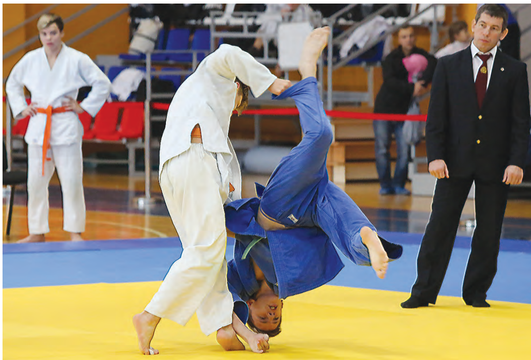
Спортсмену-дзюдоисту надо быть немного космонавтом.