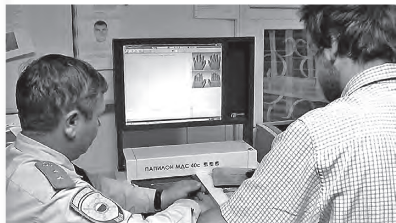
В поле зрения оперативников парочка попала в мае этого года.

По словам начальника отделения следственной части следственного управления МУ МВД России «Нижнетагильское» подполковника юстиции Елены Поздняковой, в ходе расследования уголовного дела установлено, что обвиняемыми совершено 14 преступлений имущественного характера, в том числе разбойные нападения и грабежи. По всем выявленным фактам задержанные дали признательные показания, сотрудниками полиции установлены места сбыта похищенного имущества, часть которого возвращена потерпевшим.