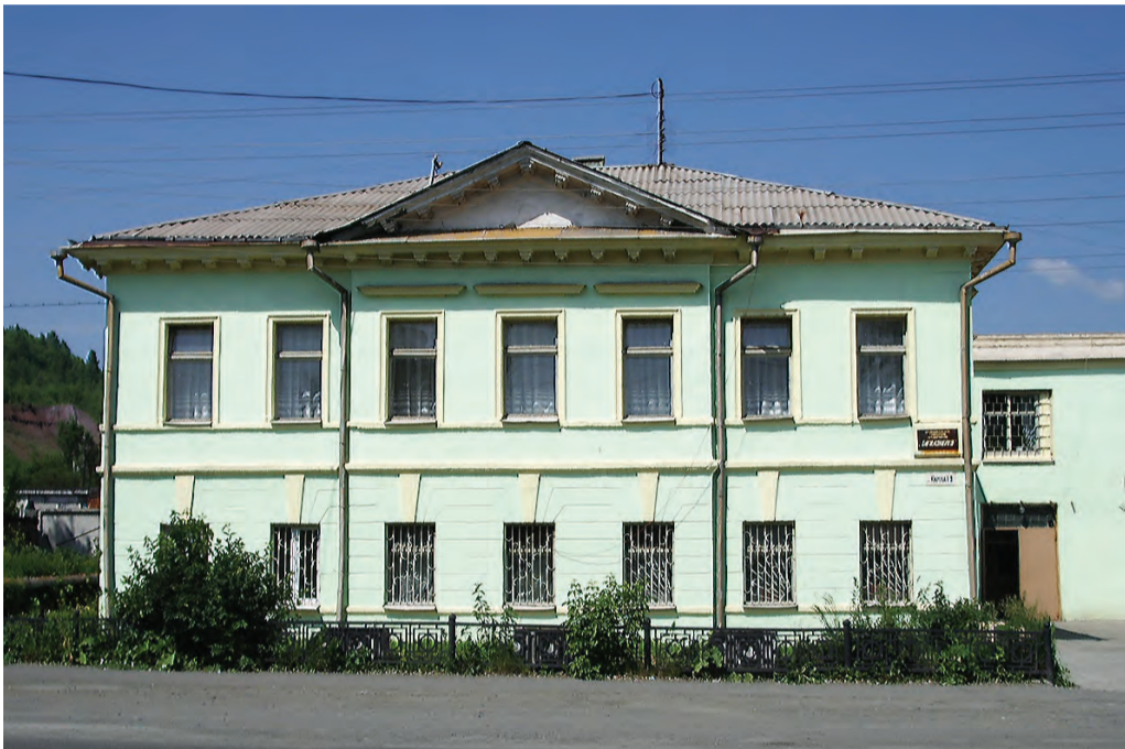
Улица Кирова, 19.

Украшением Нижнего Тагила являются неповторимые каменные дома, построенные в XIX веке. Они находились на главных улицах поселка: Александровской (ныне – проспект Ленина), Шамина (Карла Маркса), Тагильской. Подобные дома строились и на улице Большерудянской (Кирова), которая примыкала к демидовскому заводу