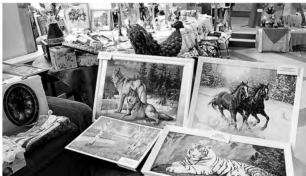
Творческие работы ветеранов Ленинского района.