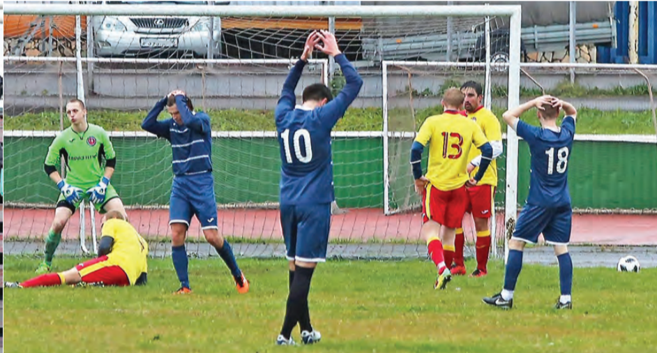
«Металлург-НТМК» в очередной раз отстоял свои ворота в матче с «Кедром».

«Металлург-НТМК», представляющий Нижний Тагил в первой группе чемпионата Свердловской области, на своем поле не сумел победить новоуральский «Кедр».