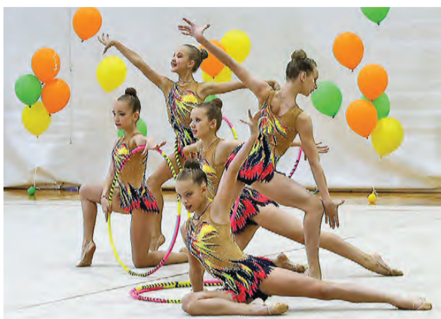
Упражнение с обручами.