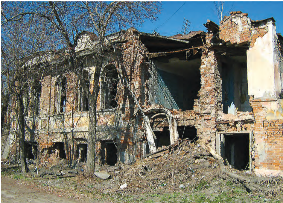
Улица Кирова, 21.

О Большерудянской улице Нижнетагильского поселка известно еще с середины XVIII века. Она была центральной в старинном «кержацком» районе Ключи, который находился между двумя вершинами – горами Лисьей и Высокой. В свое время эта улица была важнейшей транспортной артерией чугуноплавильного и железоделательного завода. По ней непрерывным потоком шли вереницы подвод, груженых рудой знаменитой горы Высокой. Селились на этой улице преимущественно люди, работающие на заводе – мастера, служащие, приказчики.