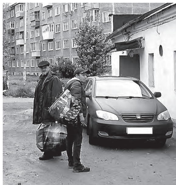
Желающих сдать металл всегда много.

С начала года полицейские провели более двухсот рейдовых мероприятий: проверялись объекты по приему лома и отходов цветных и черных металлов.