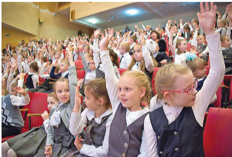
«Вы готовы быть юными тагильчанами? – Да!»

8 октября, в день основания нашего города, в городском Дворце детского и юношеского творчества началась 20-я краеведческая игра для младших школьников «Я - тагильчанин». Основная тема игры на 2018-2019 учебный год – «Здоровые дети – будущее Тагила».