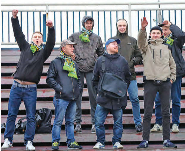
Поддержать команду из Новоуральска приехали ее фанаты.