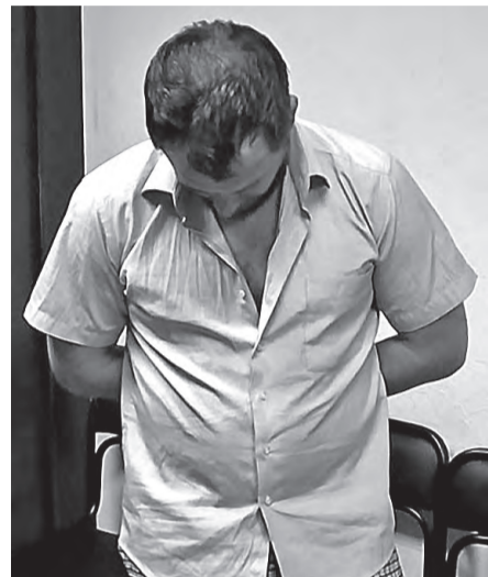
Раскаяние пришло поздно...

Налетчики действовали дерзко, иногда использовали газовый баллончик. Предметом преступных посягательств злоумышленников, как правило, становились золотые украшения, которые они грубо срывали с пожилых женщин, и деньги.