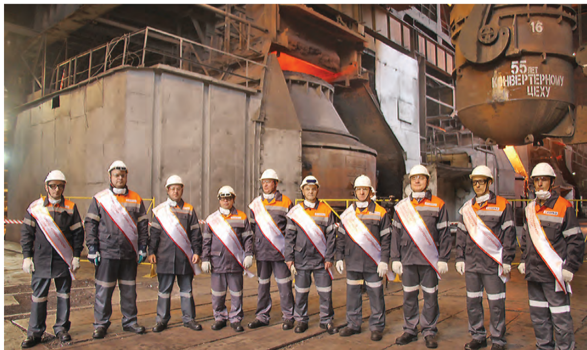
Символическая бригада юбилейной плавки.