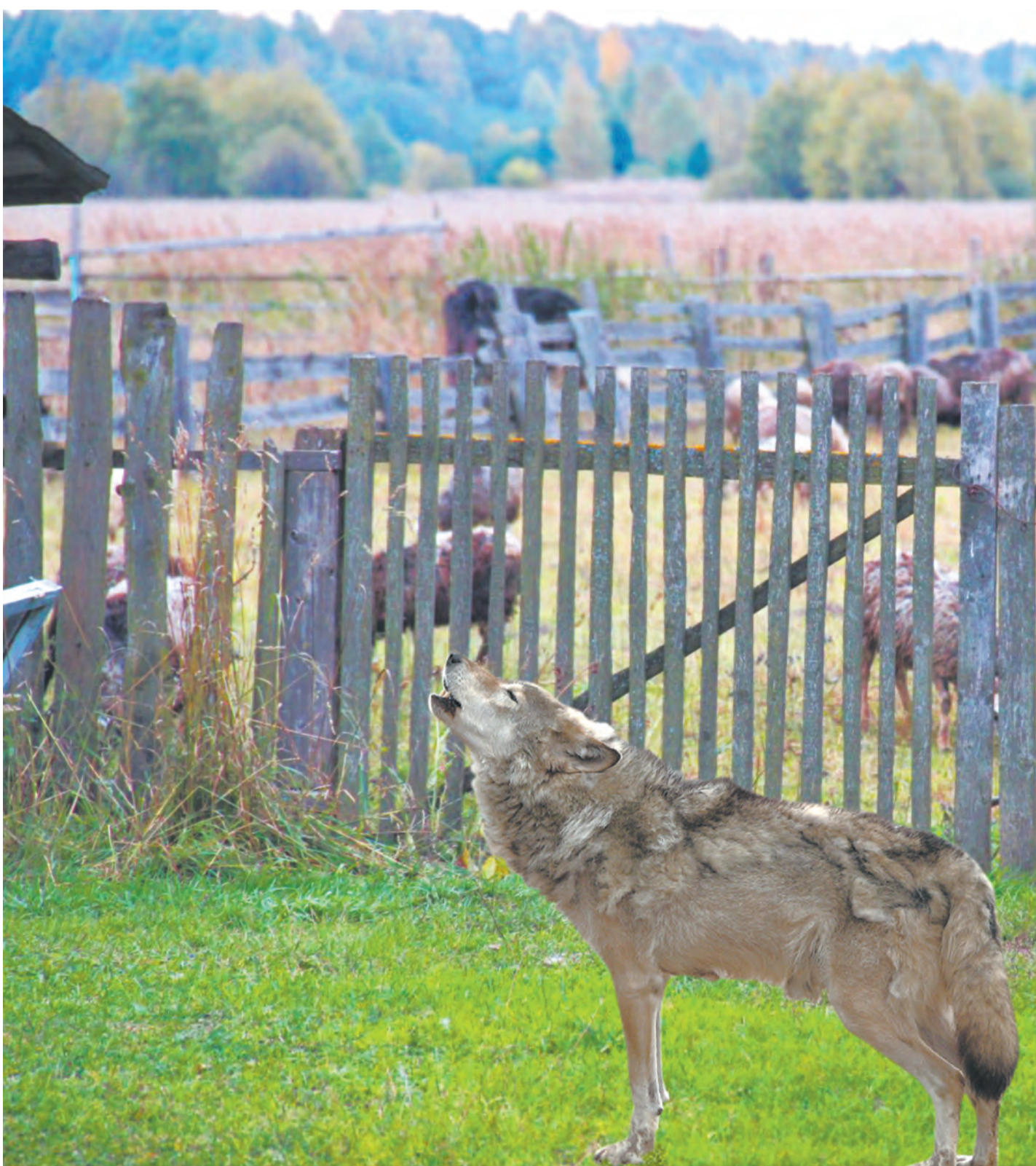
Стая волков прошла по деревне Пановой Талицкого района, утащив несколько овец из хозяйств селян.....4

ПОДПИШИСЬ на СЕЛЬСКУЮ НОВЬ I полугодие 2019 года