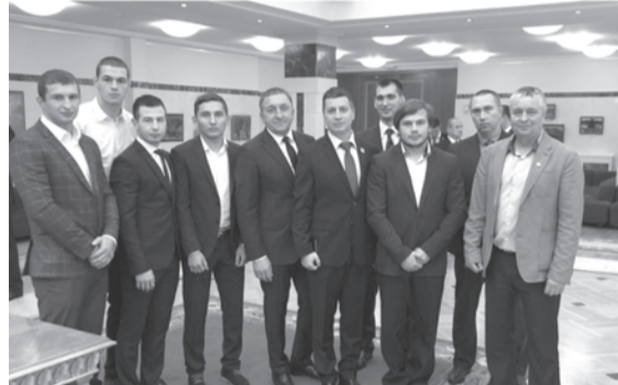
Делегация Талицкого ГО на церемонии подписания соглашения