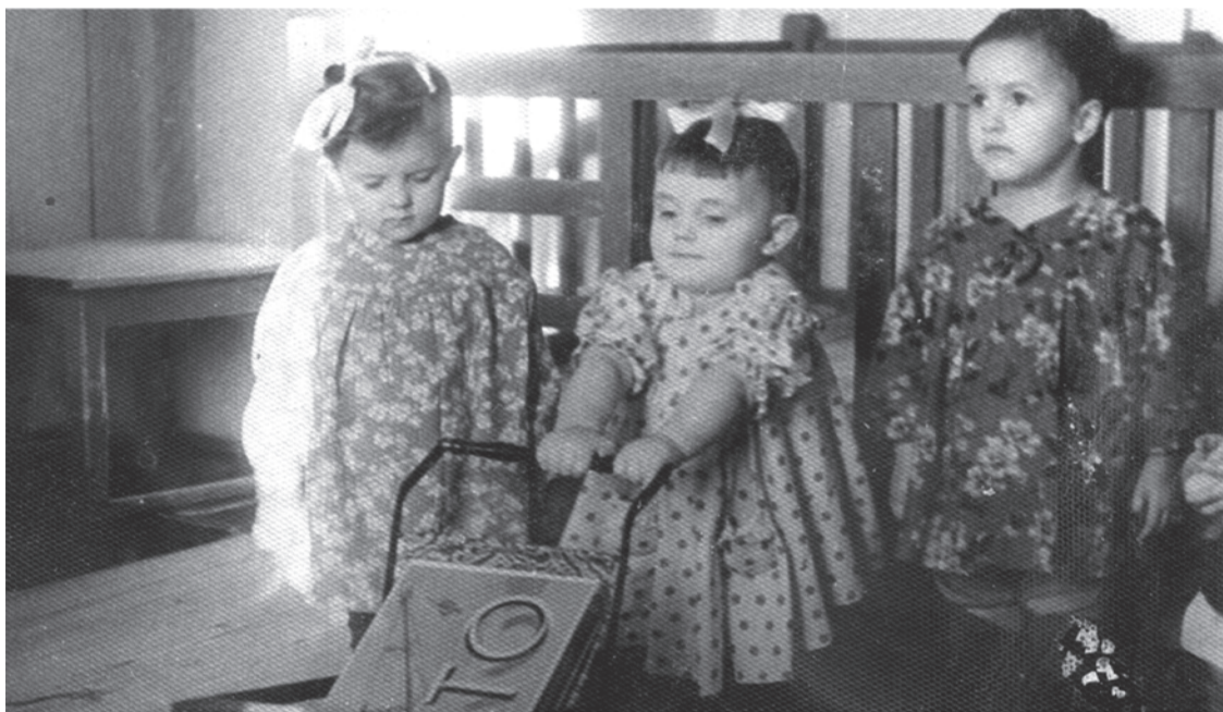
1950 годы. Малыши в детском саду.