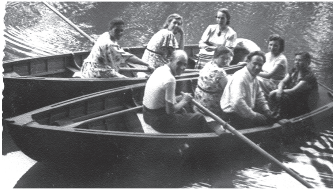
50-е годы. Лодочные прогулки на городском пруду.