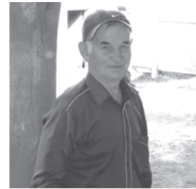
СПК 8-е Марта и Совет ветеранов

У тебя сегодня юбилей, Улыбнись и не грусти. Позабудь хотя бы на мгновение Все бывшие горести свои. Желаем радости и счастья, Здоровья крепкого вдвойне, Желаем самого простого – Пожить подольше на земле.