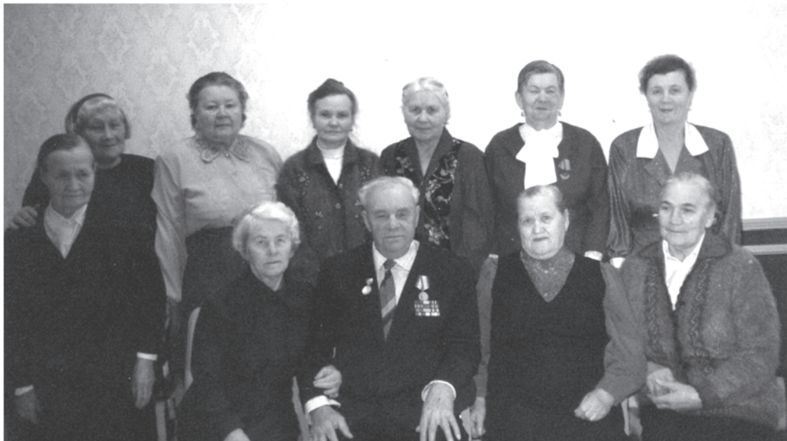
Ноябрь 1998 г. Группа пенсионеров Талицкогo молзавода в год 70-летия завода.