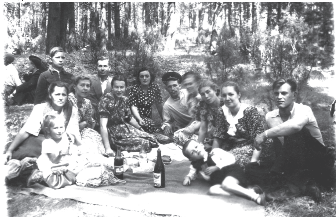
1950 год. Празднование Дня медика на Ургинском пруду.