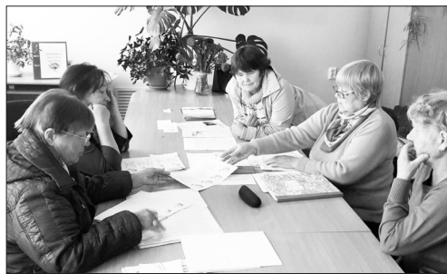
Маминские активисты обсуждают дела

школьники, дети. Что их объединяет? Стремление сделать для своей малой родины что-то хорошее, светлое, а еще стать примером для других молодых. Благодаря их усилиям ликвидирована свалка у Троицкого, почищен родник за око-