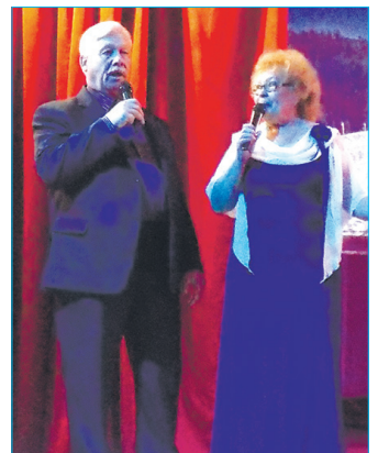
Пели сердцем и душой в Маминском