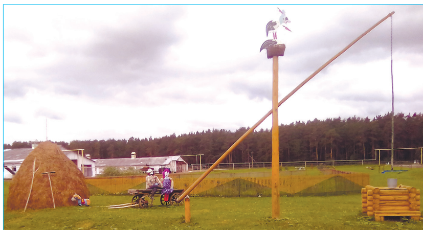
На фото: элементы дизайна на территории ПАО «Каменское»