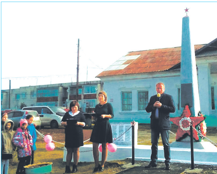
У обновленного обелиска в Кисловском прошел митинг памяти