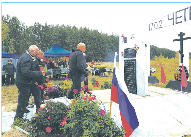
Деревни нет, но люди приезжают на землю, где они родились