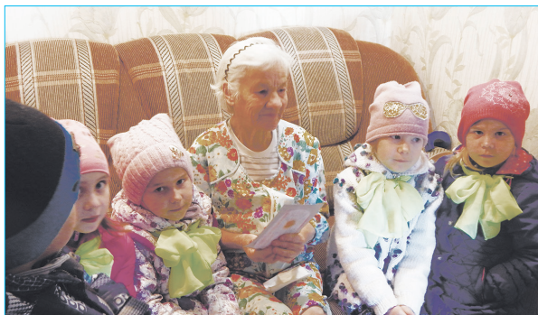
Дети из Бродовского детского сада навестили ветеранов