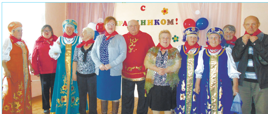
Праздник вернул в годы молодости