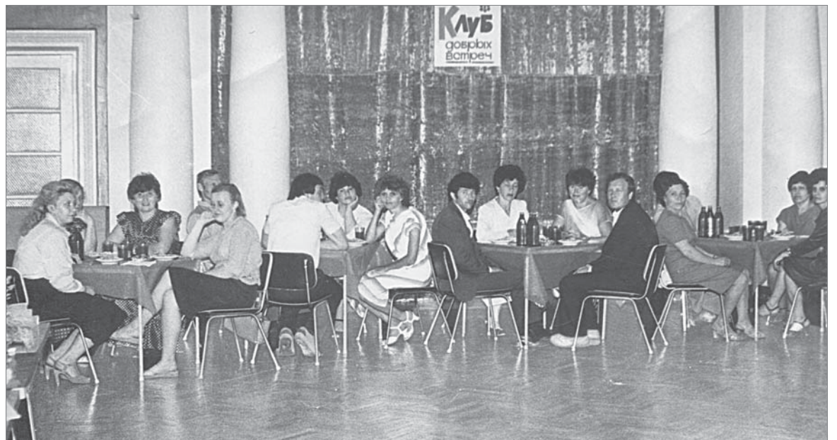
Один из вечеров «Клуба добрых встреч». 1982 год.