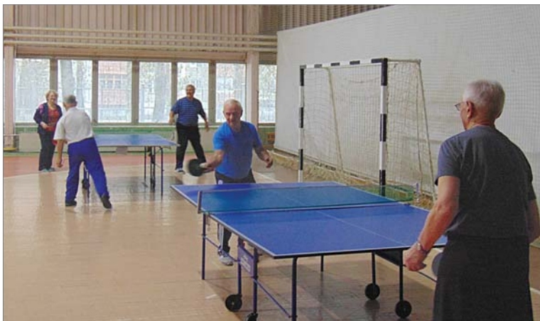
Играть в теннис ветераны любят.