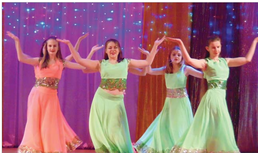
Индийский «Болливуд» от студии «Пятнашки».

63-й сезон открыт, участники и руководители готовы создавать, репетировать, восхищать.