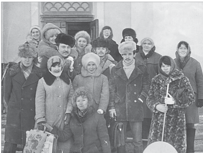
Участники фестиваля художественной самодеятельности от цеха №2 после репетиции.

Екатерина ТОКАРЕВА