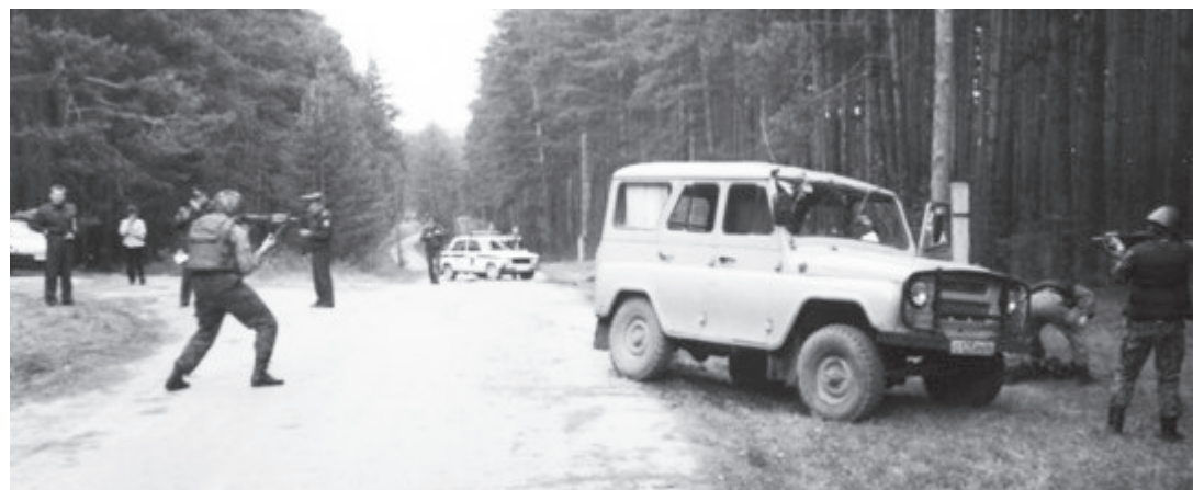
Июнь 2000 года. Учения личного состава Сысертского РОВД. Отрабатывается задержание группы преступников. Группа захвата в составе инспекторов ОУР.