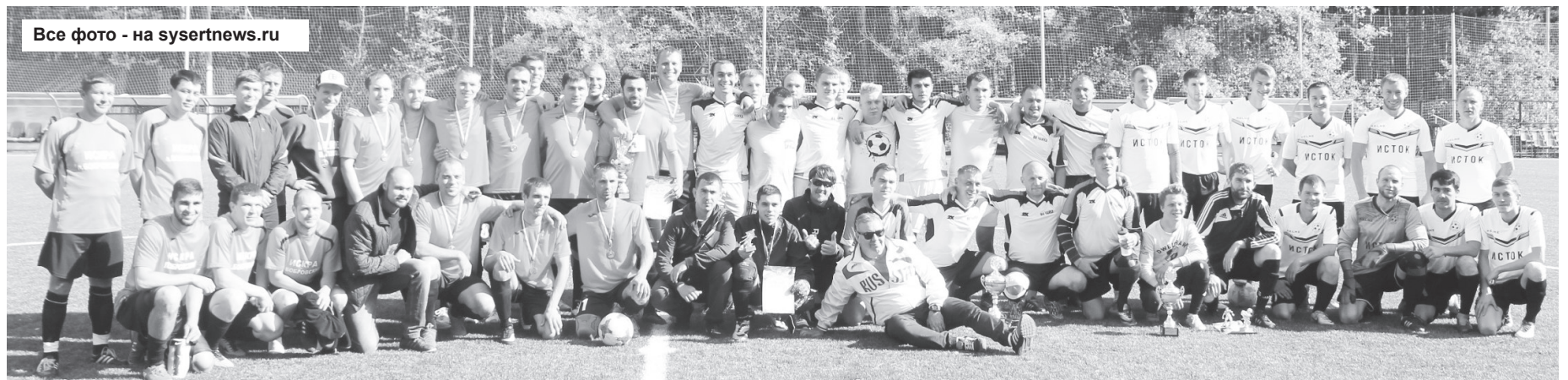
Игроки команд, сражавшихся за звание чемпионов по футболу Сысертского округа. Чемпионы - команда «Чайка» из Октябрьского - в центре.

Газета зарегистрирована в Управлении Федеральной службы по надзору в сфере связи, информационных технологий и массовых коммуникаций по Уральскому федеральному округу. Свидетельство ПИ №ТУ66-01281 от 5.03.2014 г. 16+ Издание предназначено для лиц старше 16 лет.