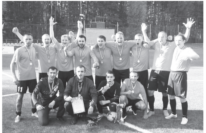
Обладатели Кубка Сысертского округа по футболу - команда «Сысерть»