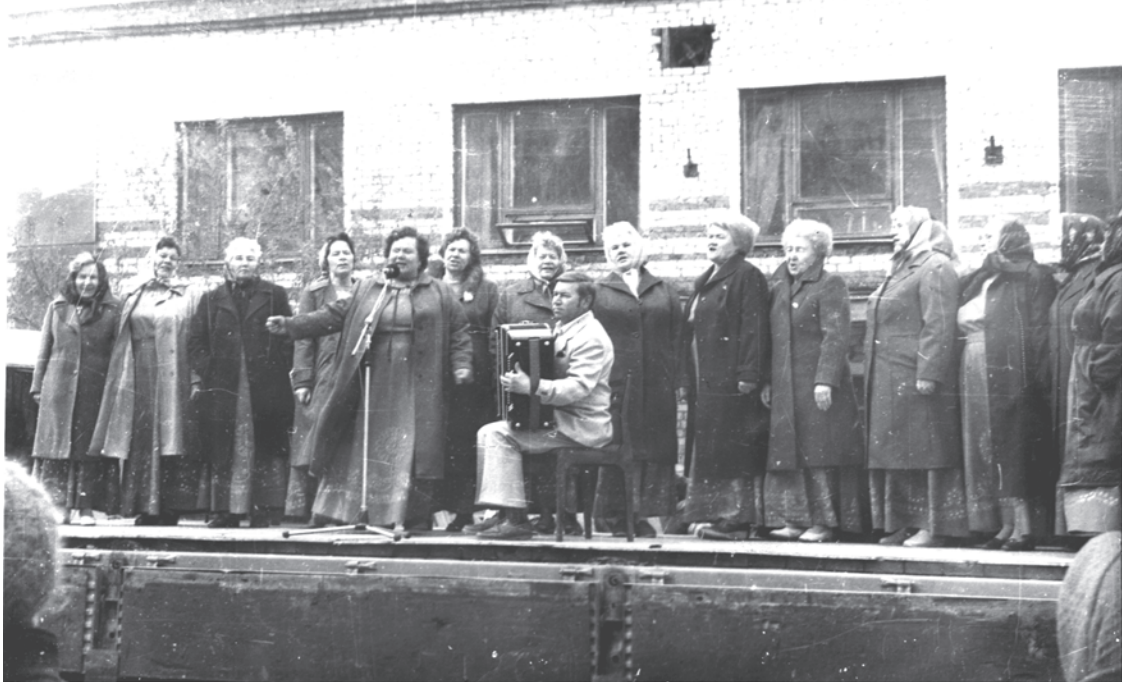
1.05.91г. Хор ветеранов на площади пос. Троицкого.