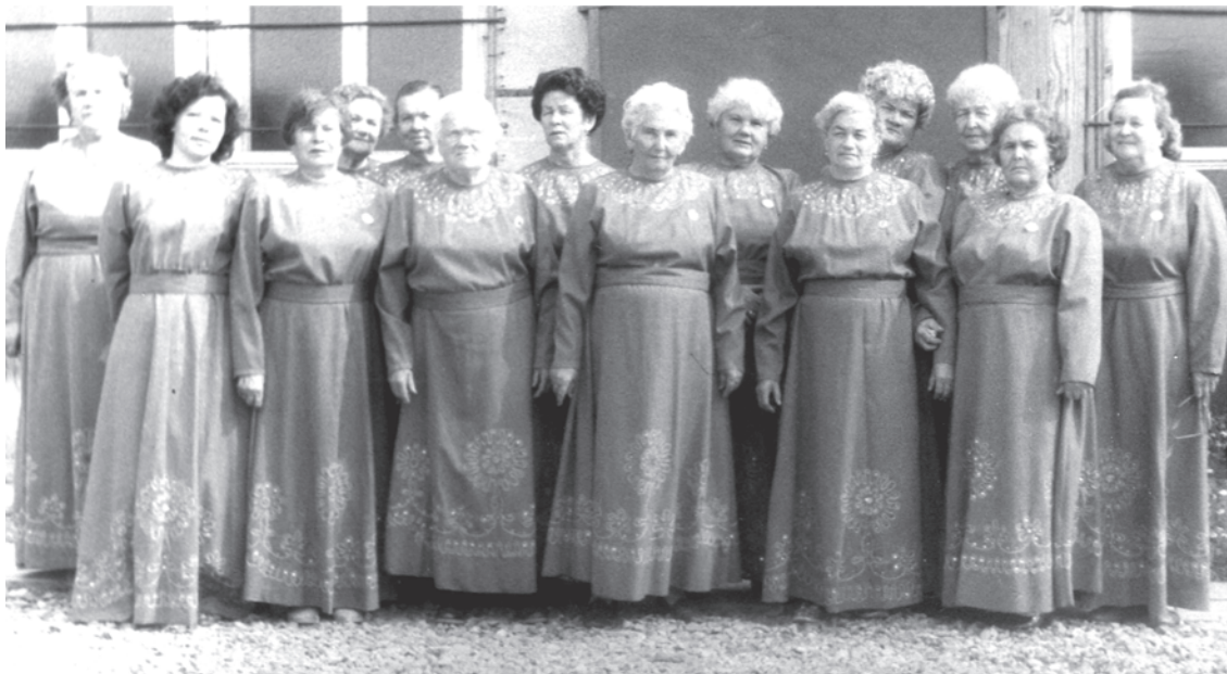
10.08.90 г. Хор ветеранов. Выступление на территории ДОКа.