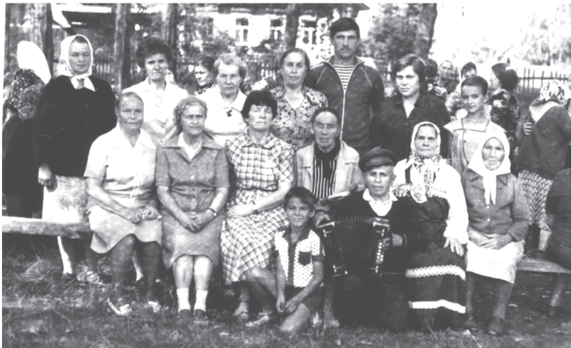
1988 г. Праздник улицы Вакурова. пос. Троицкий.