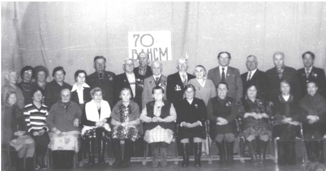
1988 г. Торжество в клубе ДОКа. Пос. Троицкий.