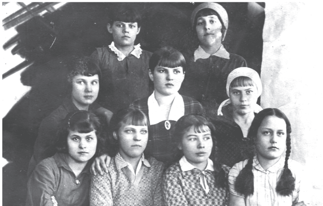
1934 г. VI учебная группа «В» школы ФЗД.