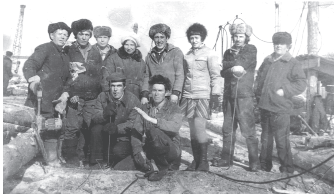
1975 г. Бригада «Мехлеса» (Урга, 19).