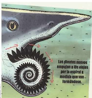
В Красноуфимске даже детсадовцы знают, как зовут рыбу с циркулярной пилой вместо языка—геликоприон.