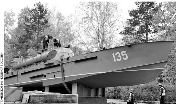
ТОМСКАЯ РО-ЕДИНОЙ РОССИИ

«Комсомолец» изготовлен в рамках проекта «Единой России» «Оружие Победы».