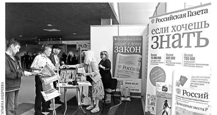
Стенд «Российской газеты» на международной выставке «Иннопром» пользуется неизменной популярностью уже много лет.