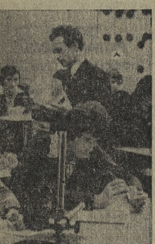
ГОТЯТСЯ РАБОТНИКИ РЕДКОЙ СПЕЦИАЛЬНОСТИ

Воронежская область. Воронежская атомная электростанция имени 50-летия СССР — крупнейшая в Европе.