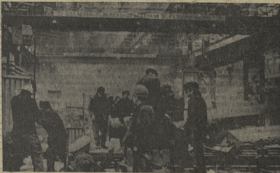
Общий вид цеха, где сооружается стан «250».