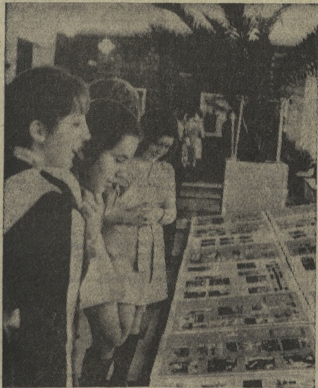
В фойе Дворца культуры, где проходила городская конференция, была оформлена фотовыставка «Молодежь Первоуральска в труде, учебе и отдыхе». С интересом знакомилась делегаты со стендами.

ПОД ЗНАМЕНОМ ЛЕНИНА 25 ноября 1975 г., № 232