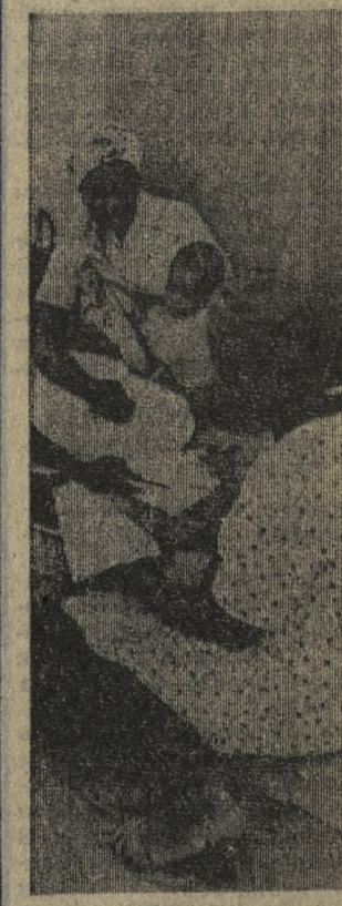
На карте Африки появилось новое независимое государство Народная Республика Ангола. На курсах ликбеза, созданных МПЛА (Народное движение за освобождение Анголы) учатся сейчас около 150 тысяч человек. Занятия курсов по ликвидации неграмотности проводятся ежедневно по адресу: на улице (на снимке).