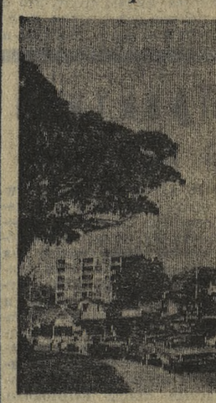
Порт-оф-Спейн — столица Тринидада и Тобаго, государства, расположенного на островах того же названия в Атлантическом океане у северо-восточной оконечности Южной Америки.