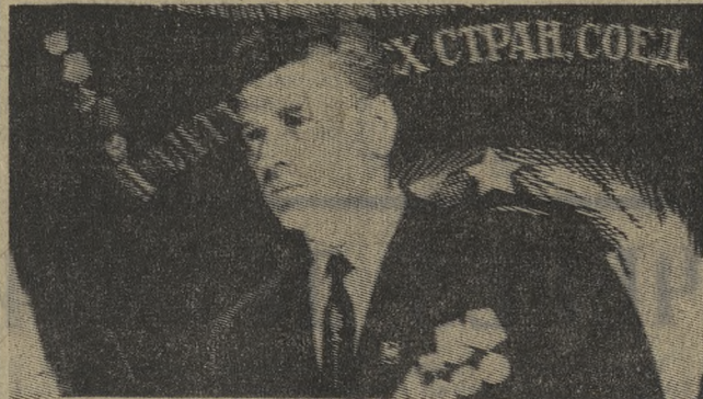
■ НОВОТРУБНЫЙ ЗАВОД

(Из Призывов ЦК КПСС к 58-й годовщине Великой Октябрьской социалистической революции).