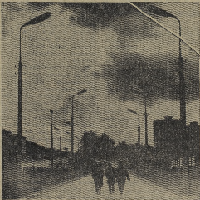
Утро рабочего города