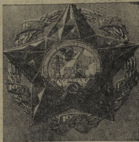
Памятный знак ЦК КПСС, Совета Министров СССР, ВЦСПС и ЦК ВЛКСМ «За трудовую доблесть в девятой пятилетке».