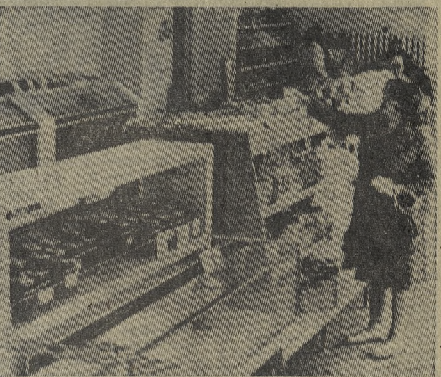
[Окончание. Начало на 1 стр.]

ку. Ясно, конечно, много хорошего сделано для производства, для людей, на нем занятых. Впрочем, это вещи всегда взаимосвязанные. Но если говорить не в общих чертах, а конкретно, как эти перемены выглядят?