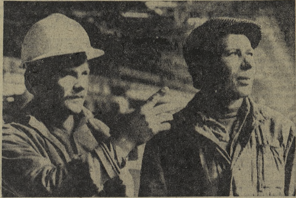
■ Капитальный ремонт стана «30-102» завершен