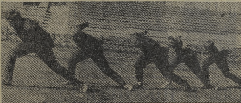
В конькобежной секции детско-юношеской спортивной школы при спортклубе «Уральский трубник» усиленно готовятся к предстоящему зимнему сезону. На снимке: отрабатывается имитация бега на коньках.