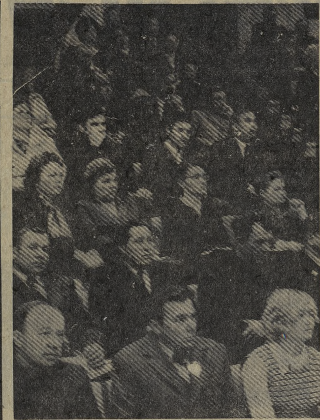
Участники научно-методической конференции пропагандистов.

Некоторые пропагандисты ставят вопрос так: если на собеседовании присутствует, к примеру, 20 человек,