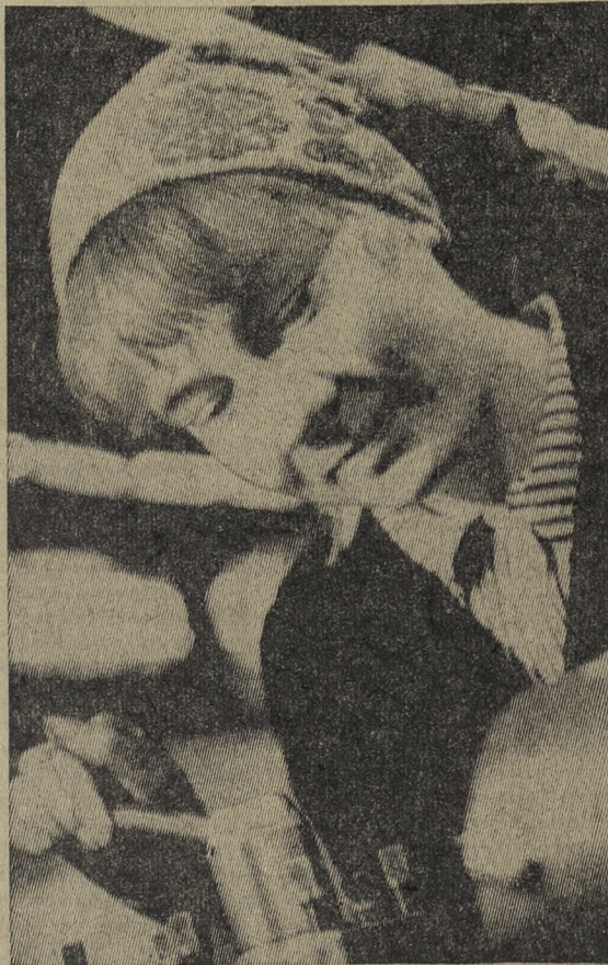
НАВСТРЕЧУ ДНУ МАШИНОСТРОИТЕЛЯ