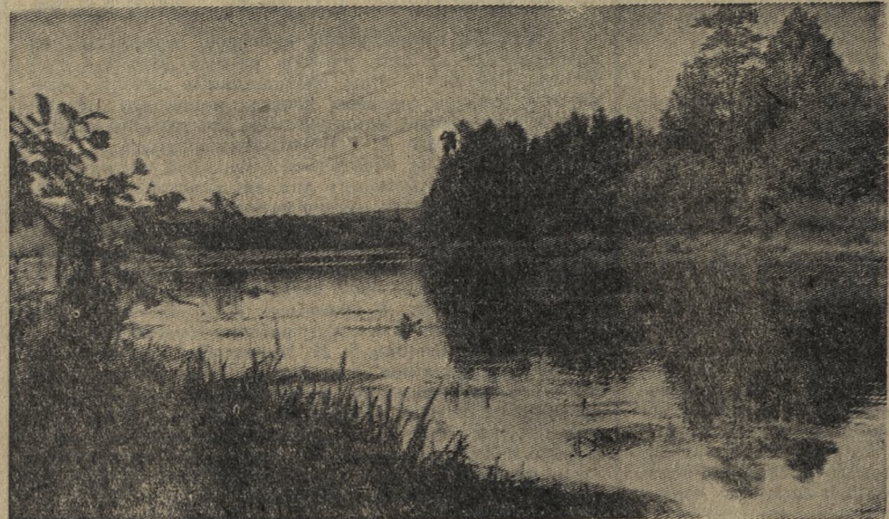
Река Чусовая в окрестностях поселка Билимбае.

ЕСТЬ под Невьянском Аятское озеро. А близ него село с таким же именем. Оно родное Людмиле. Из окна отчего дома виднеются горделивые сосны, торопливые облака, цепляющиеся за их верхушки. А выйдешь за ворота, слышно, как шумит, волнуется лес, отбиваясь от разгулявшегося ветра.