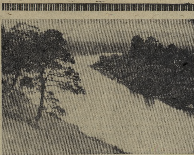
* Лирический фоторепортаж