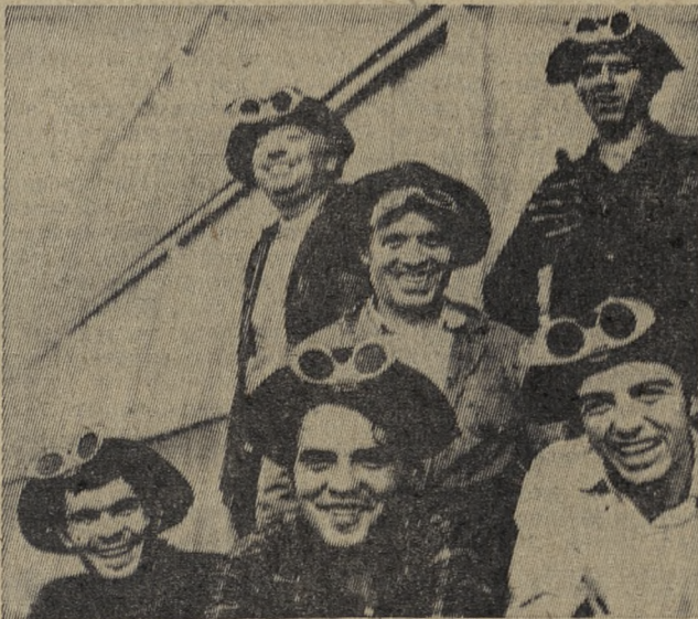
В Болгарии широко развернулось социалистическое соревнование за досрочное выполнение заданий шестой пятилетки, достойную встречу XI съезда БКП.

3 стр. ПОД ЗНАМЕНЕМ ЛЕНИНА 29 августа 1975 г., № 171