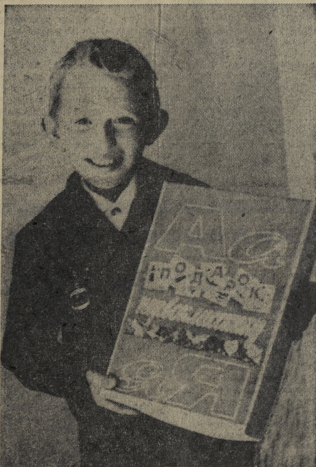
Набор для первоклассника вы можете приобрести в магазинах «Малыш» и № 14 «Канцелярские товары».

Альбом и краски должны быть у каждого! Не все дети рождаются с талантом художника, но рисовать любят все. И какое счастье, когда непослушная кисть, наконец, нарисует то, что хотелось, а урок рисования становится любимым.