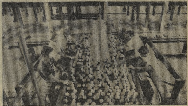
Редактор С. И. ЛЕКАНОВ.