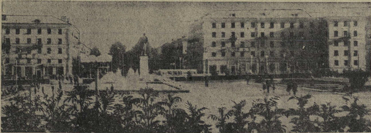
Сочной зеленью деревьев и газонов, прозрачными струями фонтана радует глаз первоуральцев центральная площадь города — площадь Победы.